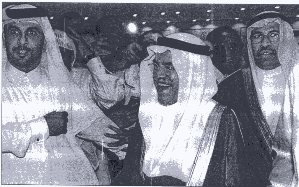
El poder de Ali Naimi —en el centro— sobre el precio del petróleo es similar a la de Alan Greenspan sobre el dólar.